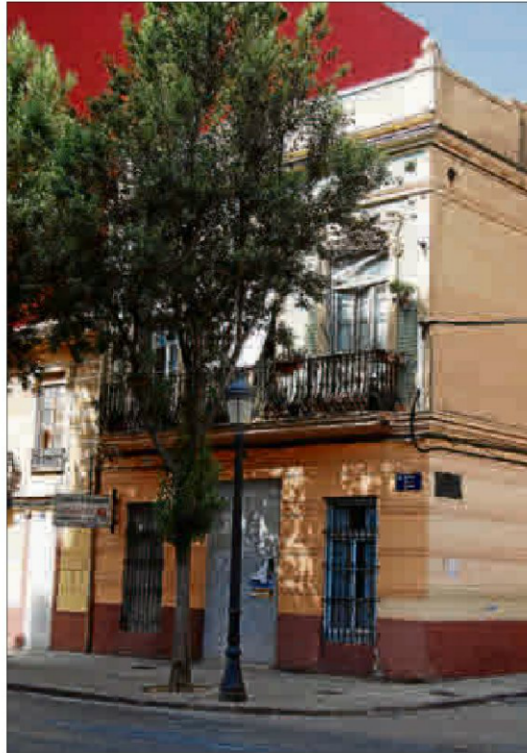
Futuro centro social del Cabanyal, ahora okupado. J.P.

Los planes que maneja el ayuntamiento pasan por atender a las familias en asuntos tan básicos como la escolaridad de los niños, el respeto por la higiene y la salubridad o las normas de convivencia, en las que también debe tener una participación directa, dijo, la Policía Local.